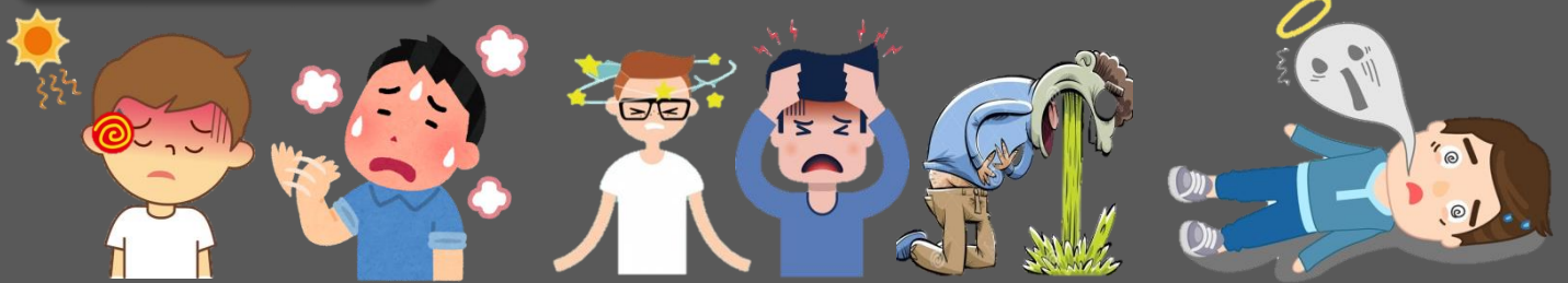
ไม่มีเหงื่อออก ผิวแห้งสีแดง