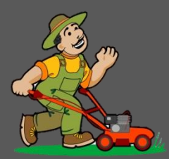
คนงานกลางแจ้ง