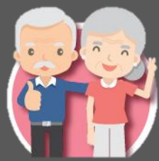
ผู้สูงอายุ